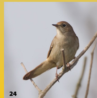
1. Kauw 2. Gierzwaluw 3. Merel 4. Zanglijster 5. Halsbandparkiet 6. Koolmees 7. Zwarte Kraai 8. Ekster 9. Pimpelmees 10. Winterkoning 11. Spreeuw 12. Huismus 13. Tjiftjaf 14. Roodborst 15. Heggenmus 16. Zwartkop 17. Turkse Tortel 18. Vink 19. Gaai 20. Grote Bonte Specht 21. Staartmees 22. Ooievaar 23. Boomklever 24. Nachtegaal