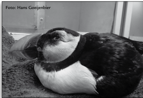
Stormslachtoffer - papegaaiduiker

Wim Kooij waarschuwt dat dat waarschijnlijk niet altijd zo zal zijn en dat we dan het risico lopen dat we niet aan de verplichtingen kunnen blijven voldoen. Aletta de Ruiter antwoordt dat het bestuur de verplichting heeft om actief op zoek te gaan naar financiële middelen. Het is geen ongebruikelijke bedrijfsvoering voor een ANBI-organisatie. De Haagse Dierenbescherming is ook afhankelijk van fondsenwerving en draait al jaren met 7 beroepskrachten om het bedrijf gaande te houden. Hetzelfde geldt voor de dierenambulances. Indien de geldstroom stopt, is er een risico dat er over een paar jaar weer ingekrompen moet worden, maar daar ziet het voorlopig niet naar uit.