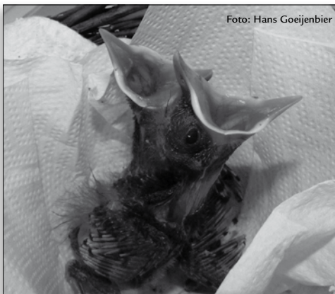
verweesde jonge merels

Qua onderhoud kreeg De Wulp afgelopen jaar een grote beurt. In de aanloop naar een nieuw vogelasiel is het natuurlijk zonde om nog heel veel geld uit te geven aan onderhoud, maar aangezien de fondswerving voor het nieuwe gebouw niet echt hard gaat, zullen we toch zuinig moeten zijn met de huidige locatie. Groot was de schrik toen werd ontdekt dat de dakconstructie van de babyroom aan het doorzakken was. Dit moest echt vervangen worden. En toen we toch eenmaal aan het controleren waren, bleek