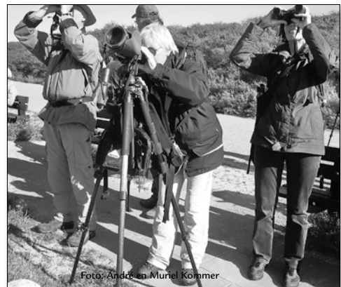
met elkaar genieten van vogels

Vanaf de vriendelijke ontvangst op maandagmiddag tot en met het afscheid na het perfecte ontbijt op vrijdagmorgen, was het verblijf heel goed met uitstekende maaltijden, goede kamers en verzorging. Gedurende deze midweek kon het natuurschoon in deze provincie echt goed bekeken en beleefd worden, ondanks de minder goede weersomstandigheden de eerste dagen. Ruim 80 vogelsoorten, vele soorten dieren en heel veel soorten planten, bomen, paddenstoelen, mossen etc. werden ontdekt. Het was een goede en gezellige midweek. Bij het eindpunt vonden de deelnemers dat zij de volgende keer