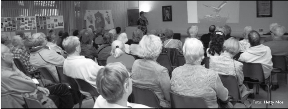
lezing over de ooievaar druk bezocht