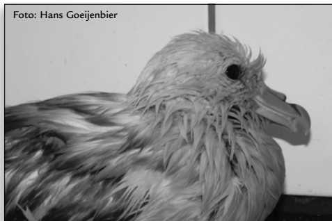
Stormslachtoffer - noordse stormvogel