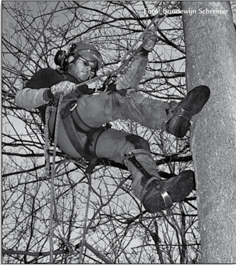
voor het veilig stellen van een es is soms het nodige klimwerk vereist

ontstaan in de vogelrustgebieden door de hevige stormen. Met name in de vogelrustgebieden 'Gravin van Bylandt' en 'Marlot'.