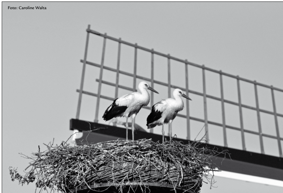
ooievaarsjongen bij molen De Vlieger