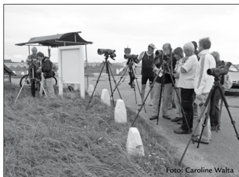
met deze apparatuur komt de vogel een stuk dichterbij

Haagse Bos. Met 2 grote kramen konden we voor zowel de Egelopvang als de Vogelbescherming onze informatie en spullen voor de verkoop neerleggen. Voor de knutselkraam was weer veel belangstelling: egels kleien, uilenballen uit elkaar halen en vingervogels maken. Dat trok de meeste belangstelling. Kleurplaten zijn meer uitgedeeld dan ter plekke ingekleurd.