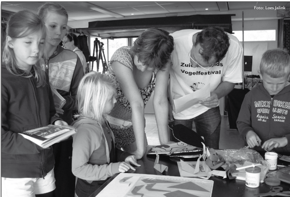
knutselen voor jong en oud