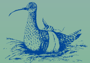
Vogelasiel De Wulp