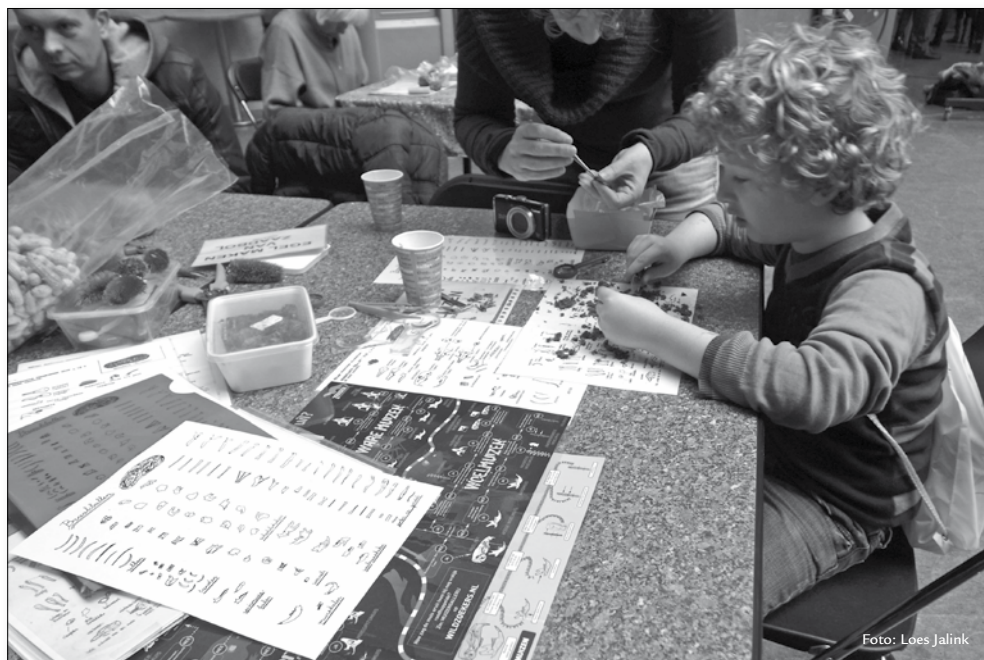
Braakballen pluizen tijdens de PR-markt in de Haagse Hogeschool

winteraars in Den Haag de dag ervoor al was gedaan, is deze gelegenheid vooral aangegrepen om geïnteresseerden en toevallige passanten te informeren over de ooievaars in Den Haag en over de