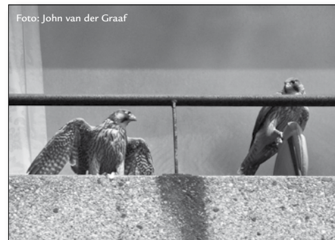
slechtvalk jongen in Den Haag

De penningmeester licht toe dat er op dit moment geen zicht is op locaties voor nieuwbouw. Daarnaast blijkt de gemeente geen instrumenten van ruimtelijke ordening te hebben om het asiel van de huidige locatie weg te krijgen. De huisvesting is op dit moment echter volstrekt onvoldoende, zodat nieuwbouw of op zijn minst ingrijpende renovatie van het huidige asiel noodzakelijk is. Het is nog niet duidelijk of de gemeente de daarvoor noodzakelijke medewerking zal willen verlenen. We zitten dus momenteel wat betreft de huisvesting van het asiel in een impasse en het bestuur beraadt zich op de volgende stappen.