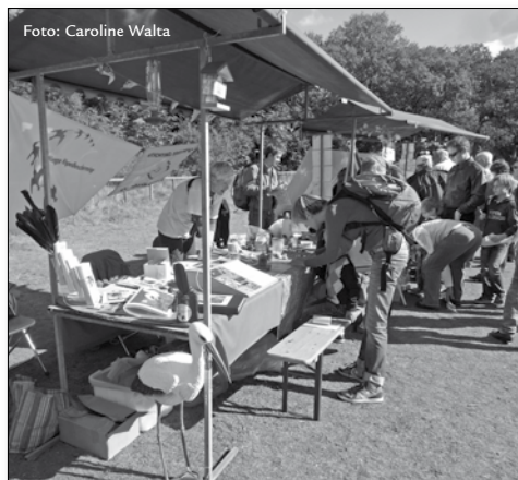
De kraam trekt altijd publiek

Dit jaar is de vereniging allereerst naar buiten getreden bij de, inmiddels jaarlijkse, ooievaarstelling op 13 januari bij de Bezuidenhoutseweg. Ofschoon de eigenlijke telling van het aantal over-