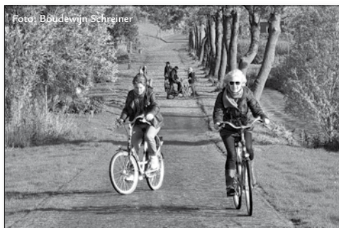
Fietsen en vogels kijken tijdens het jaarlijkse uitje met de vogelwachters op het eiland Tiengemeten

Als dank voor hun inspanningen organiseert de Commissie Veldwerk jaarlijks een gezamenlijk uitje. Dit jaar ging het uitje naar het eiland Tiengemeten waar fietsen klaar stonden om de leuke vogel-