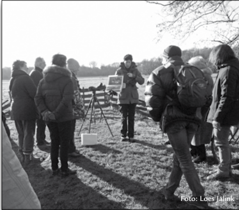
Uitleg tijdens de ooievaarstelling