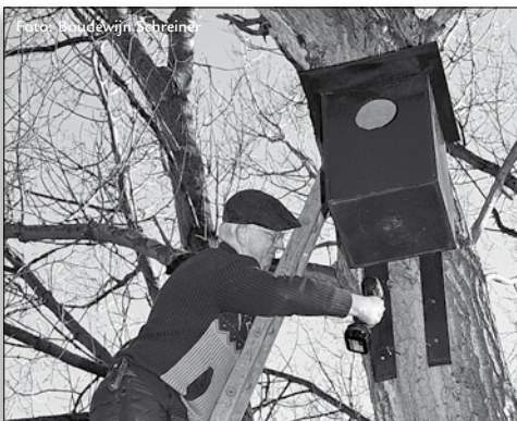
Voor het ophangen van een zware bosuilenkast in de André van der Laan tuin moest een dikke boom worden uitgekozen.