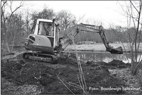
Voor de aanleg van een natuurvriendelijke flauw aflopende oever in het Gravin van Bylandt vogelrustgebied was de inzet van groot materiaal noodzakelijk.

Westduinpark, Meer en Bos, Clingendael, en Marlot-Reigersbergen. De gegevens zullen worden opgenomen in de NDFP (Nederlandse Data Bank voor Flora en Fauna).