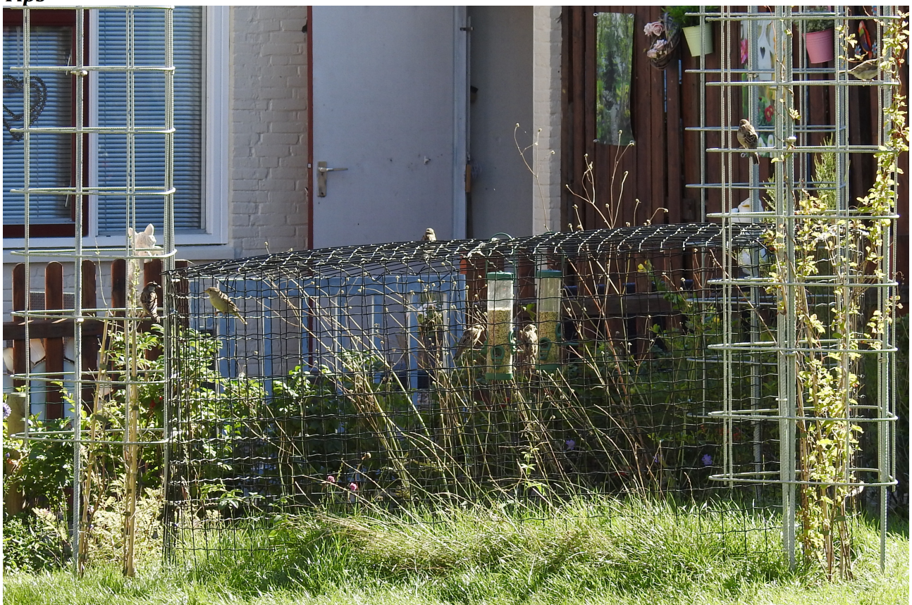
Veilige voederplaats met daarin twee voedersilo's. Toegankelijk via de zijkant.

Een snelle bezetting van de nestkast voor huismussen wordt in de hand gewerkt als er;