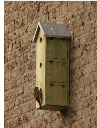
Wel kijken maar niet broeden

Veel mussenflats worden gemaakt met te kleine nestruimten. Ze worden wel bezocht, maar door de dames niet goed bevonden. Onderzoek naar huismusnestplaatsen in succesvolle kasten toont aan dat nestruimten bolvormig zijn en een inwendige ruimte hebben van \varnothing 105-110 mm. Het overgebleven deel is geheel opgevuld met nestmateriaal. Behalve het nest dient de ruimte ook geschikt te zijn voor een plaats waar de oudervogel gedurende het voeren van de grotere jongen en het schonen van het nest kan zitten. Een minimale inwendige ruimte van 135 bij 135 mm is dan ook gewenst om een volwaardig nest met jongen uit te kunnen laten vliegen. Bij meerdere projecten is gebleken dat nestkasten met de opening aan één zijde slechts door één paar huismussen wordt gebruikt.