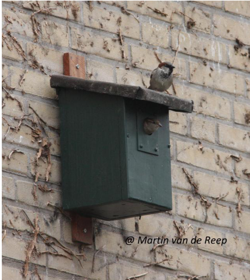
Hardhouten ophanglat en invliegopening beschermd met aluminium plaatje. Naad tussen ophanglat en dak is afgekit