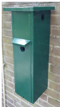
Uitvoeringsvorm: Grenenhout: geschilderd

Het uitgangspunt bij de detaillering is dat de nestkasten worden uitgevoerd in Western Red Cedar (WRC). Door WRC toe te passen hoeft het hout niet behandeld te worden en wordt er een kast aangeboden die 30% minder weegt dan een nestkast van vuren, grenen of een goede kwaliteit watervast verlijmd multiplex. Bij toepassing van multiplex altijd de gezaagde kanten behandelen met lijm of tweecomponentenplamuur om delaminatie op korte termijn te