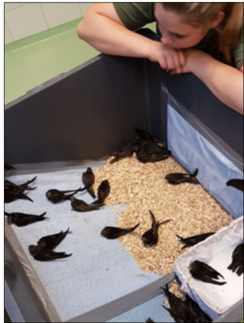
Vele, vele gierzwaluwen

Tot slot: we hebben afscheid moeten nemen van een aantal heel fijne collega's. Het vinden van een baan, een verhuizing of medische klachten hebben 'roet in het eten gegooid'. Zeker voor op de zondag óf straks vanaf april in de avonduren, hebben wij nieuwe collega's nodig.