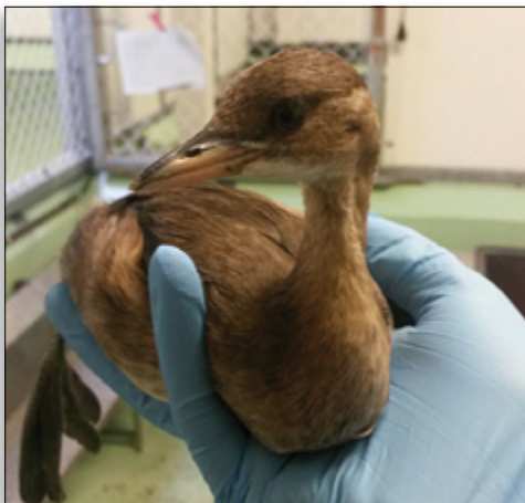
Dodaars in goede gezondheid losgelaten

Qua huisvesting zijn er ook wat aanpassingen geweest. Om veerbeschadigingen