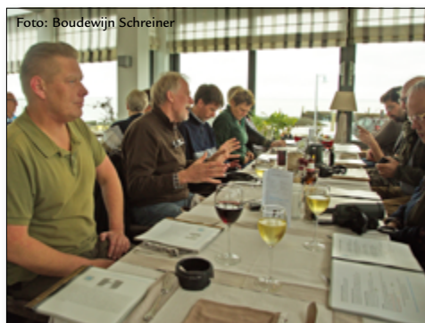
Gezellige lunch tijdens het Vogelwachtersuitje

In 2017 ging het jaarlijks door de Commissie Veldwerk georganiseerde vogelwachtersuitje via Stellendam naar Schouwen-Duiveland.