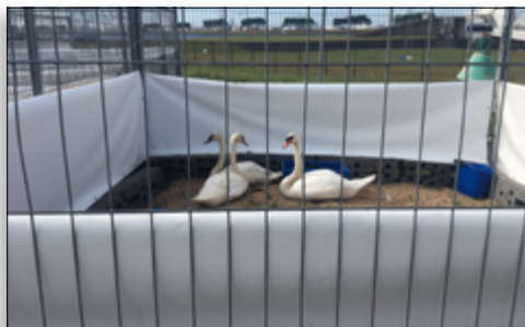
De laatste zwanen worden vrijgelaten

eenden) uitplaatsen naar andere opvangcentra zodat wij zelf ook nog een beetje ademruimte hadden.