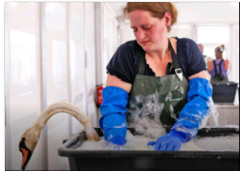
Besmeurde zwanen wassen

Begin juni start het meeuwenseizoen! Op 24 juni bereikt ons het dramatische bericht dat in de haven van Rotterdam een olieramp had plaatsgevonden. We hebben er een artikel over geschreven in De Wulp van augustus 2018.