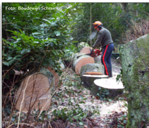
Omgewaaide haagbeuk in Vogeltuyn Marlot

verheugd dat het gelukt is om onze geleerden met drie goed opgeleide en uitgeruste zagers te versterken.