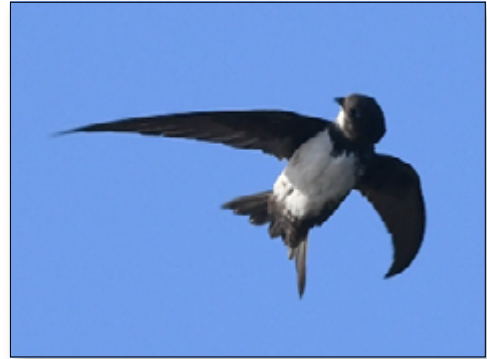
Een alpengierzwaluw in de opvang

De eerste jonge eendjes komen binnen en niet lang daarna volgen de eerste merels. Dan is het wachten op de eerste gierzwaluw en begint het écht! En die eerste 'zwaluw', dat was een heel bijzondere. Op 25 april kwam een alpengierzwaluw binnen! Het is geen geheim dat wij gek zijn op gierzwaluwen, maar een alpengierzwaluw hebben wij nog nooit in de opvang gehad! Sterker nog, geen enkele