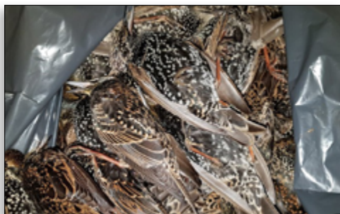
Een zak vol dode spreuwen

De dierenambulance kwam op 19 oktober met een melding over vreemde spreuwensterfte in het Huijgenspark in Den Haag. In de weken daarna kregen wij in totaal zo'n 350 dode spreuwen binnen van die locatie. Onderzoeken zijn