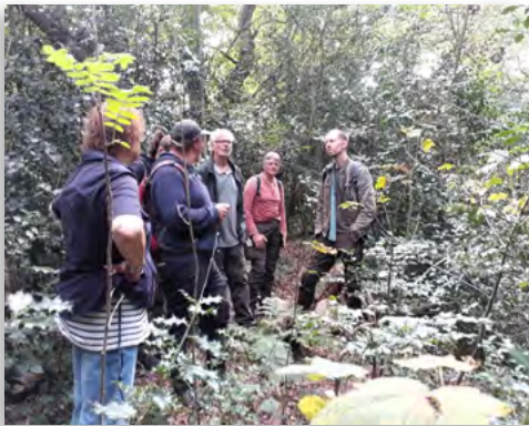
Beheerschouw Flora en Fauna Expert