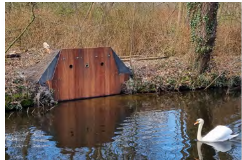
Ijsvogelwand klaar voor gebruik