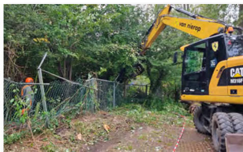
Verwijderen van het beschadigde hek