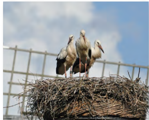
Jonge ooievaars rusten op het nest

Minder goed nieuws is er over het boomnest bij Manege Berestein: op 3 november brak er een grote tak af, waardoor het nest naar beneden is gestort. Het is even aankijken wat de ooievaars gaan doen. Het zou veiliger zijn als ze, in plaats van de oude plek langs de doorgaande weg, kiezen voor