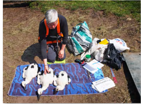
ringen, meten en wegen van jonge ooievaars