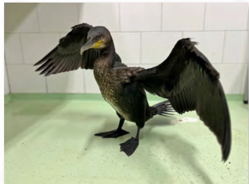
Aalscholver weer opgeknapt in vogelopvang De Wulp