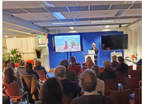
Lezingen heel goed bezocht in het ANWB-gebouw