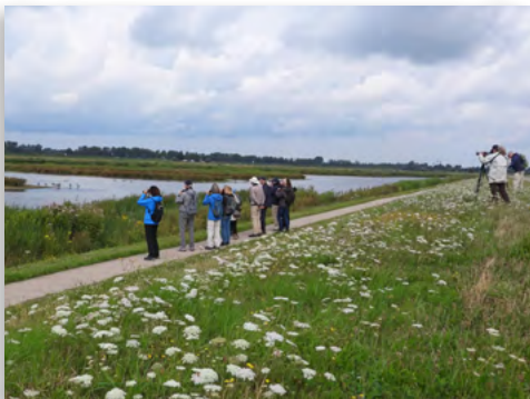
CEL excursie naar de Eendragtspolder