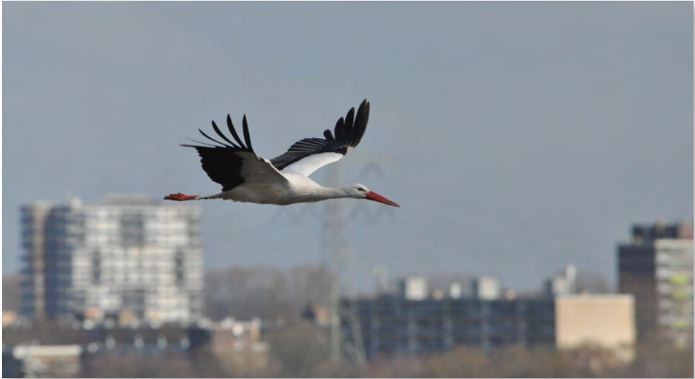
Ooievaar zweeft boven de stad