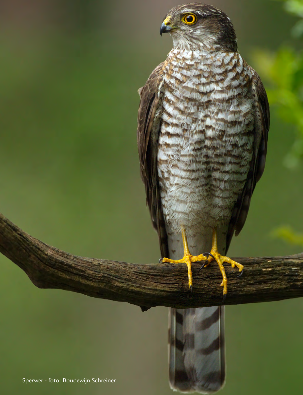
Sperwer - foto: Boudewijn Schreiner