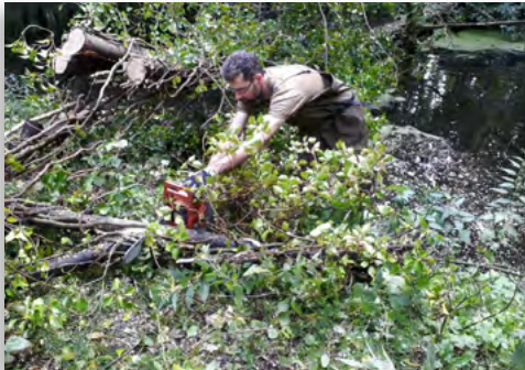
Het waadpak en de motorzaag moesten eraan te pas komen om drie over de sloot gevallen bomen op te ruimen.