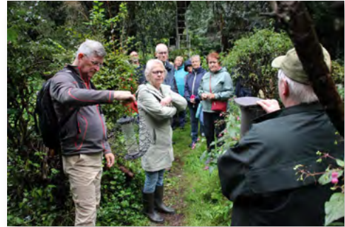
Uitleg tijdens één van de drie rondleidingen