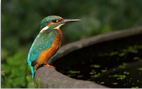
Ijsvogel kwam op de rand van de drinkpoel zitten