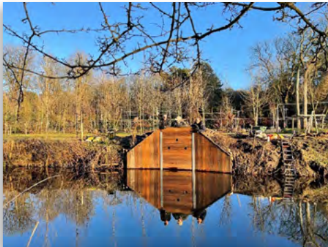
De ijsvogelbroedwand in de Stadskwekerij

Foeke Zeilstra wnd. lid Dagelijks Bestuur