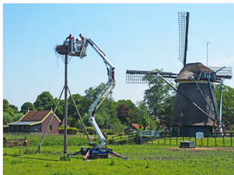
Ooievaarsringen met dank aan sponsor VSVK